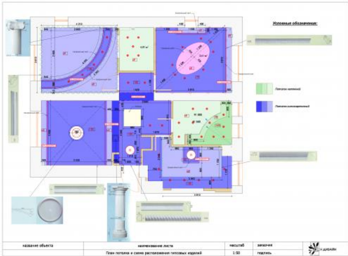
Рисунок 1.2. План потолка

Рисунки, иллюстрации каждого приложения обозначают отдельной нумерацией арабскими цифрами с добавлением перед цифрой обозначения приложения. Например - «Рисунок А.1», «Рисунок А.2» и т. д. Цифровой материал рекомендуется оформлять в виде таблиц. В том случае, когда текст иллюстрируется таблицами, они оформляются следующим образом. Таблицы следует размещать сразу после ссылки на них в тексте. Таблицы должны нумероваться внутри каждого раздела (например, ко второму разделу следует записывать Таблица 2.1, Таблица 2.2, Таблица 2.3 и т.д.) в пределах всей пояснительной записки арабскими цифрами без точки. Над левым верхним углом таблицы помещают надпись «Таблица» с указанием ее порядкового номера. Каждая таблица должна иметь заголовок, который помещают над соответствующей таблицей в одну строку с номером. Подчеркивать заголовок не следует. Если таблица прерывается, и ее продолжение располагается на следующей странице, то над таблицей пишут «Продолжение таблицы...».